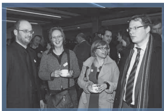
prof. em. Mark Eyskens, minister van Staat